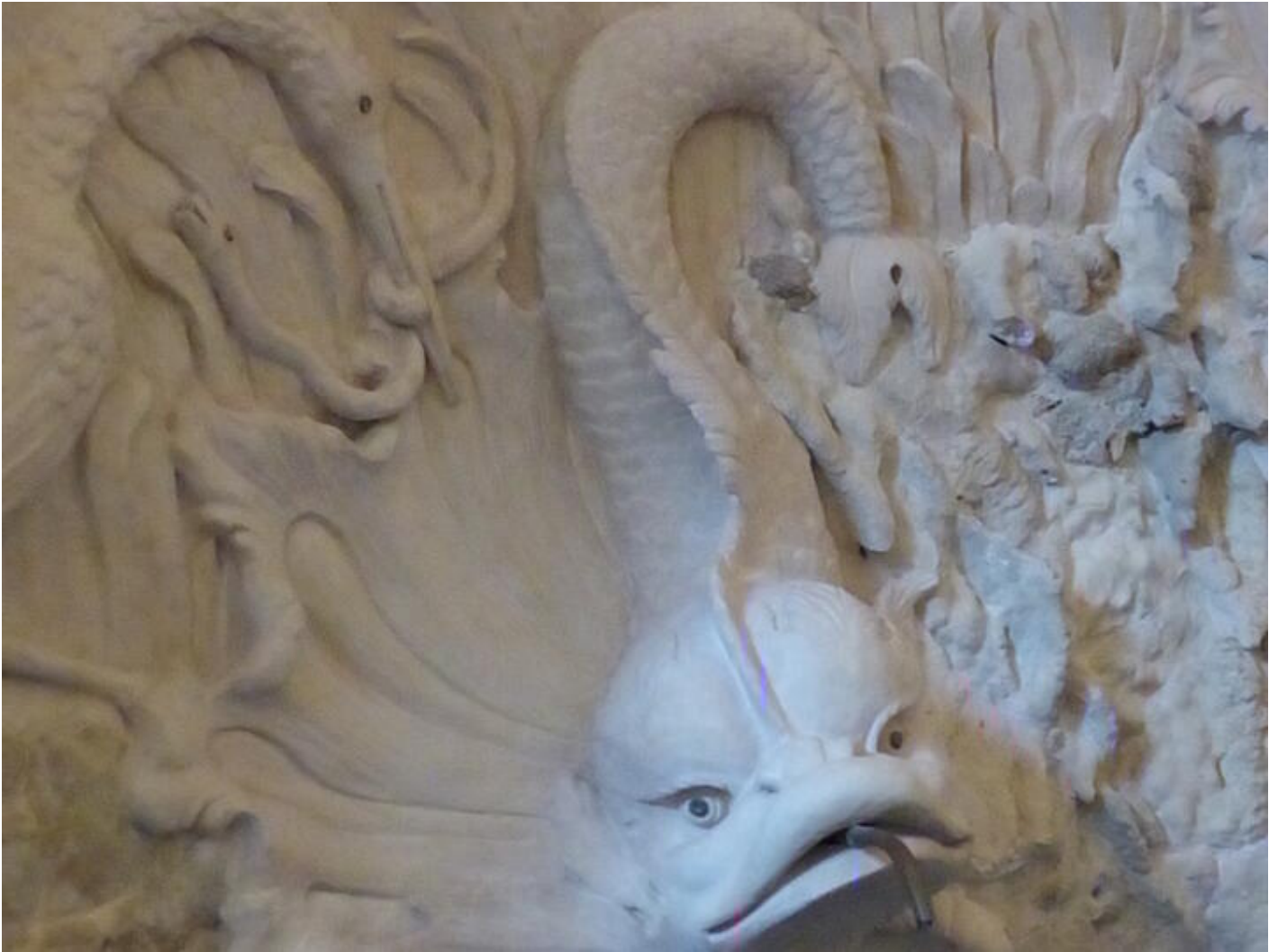
Visite guidée Saint-Antoine au fil du temps - Le temps du renouveau : art et collections 38160 Saint-Antoine-l'Abbaye

Visite permettant de découvrir des espaces qui ne sont pas ouverts au public.